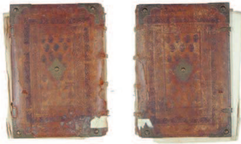
Rixners Thurnierbuch; Zustand vor der Restaurierung (Rück- und Vorderseite)

deckelband«, dem typischen Gebrauchseinband des Mittelalters und der Frühen Neuzeit, bestehen die Deckel unter dem Lederüberzug aus Buchenholz. Der Holzdeckelband ist zumeist auf Hanfbünde geheftet, die sich am Rücken unter dem Leder erhaben abzeichnen. Diese Bünde wurden durch Bohrungen im Holzdeckel gezogen und verflocht. Am Vorderschnitt werden die Deckel durch Schließen zusammengehalten. Die bei Holzdeckelbänden in den meisten Fällen vorkommenden Beschläge haben sowohl Schmuck- als auch Schutzfunktion.