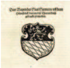
»Das Wapen der Stat Siemern uff dem Huneß-ruck, darinn dis Thurnier-buch ist worden«

Janssens | Ruxners Thurnierbuch von 1530