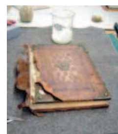
Einledern des Buchblockrückens