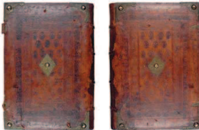
Rixners Thurnierbuch; Zustand nach der abgeschlossenen Restaurierung (Rückseite / Vorderseite)