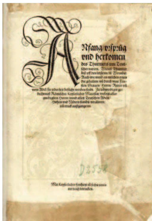
Rüxners Thurnierbuch, Titelblatt

Georg Rüxner, nach eigener Schreibweise auch Rixner 1 , war pfalzgräflicher Herold und Verfasser des 1530 erstmalig erschienenen Turnierbuchs. Es gilt als das umfangreichste und berühmteste der in der ersten Hälfte des 16. Jahrhunderts entstandenen Turnierbücher und zählt zu den Postinkunabeln. 2