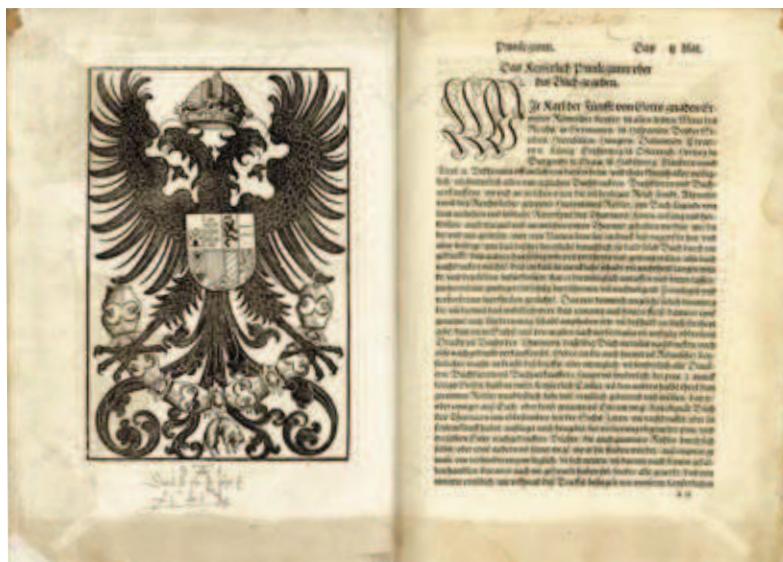
Dedikation in ausführlicher Form einer Widmungsvorrede für Karl V. (re.); Großer Wappenholzschnitt Karls V. (li.)