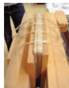
Abpressen des gehefteten Buchblockes

Die fehlenden Schließenhaken und Schließenriemen sollten nicht rekonstruiert werden, da die Holzdeckel schwer genug sind und ein zusätzliches Zusammenhalten des Buchblockes technisch nicht nötig ist. 10 Außerdem lagen keine Hinweise auf die ursprüngliche Ausgestaltung der Schließen vor.