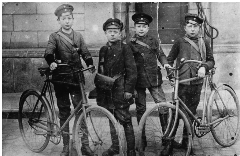
Jugendliche Fahrradpostboten, um 1910