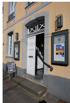
Am »Tag der Archive« waren die Türen des Stadtarchivs an der Oberstraße weit geöffnet

Am ersten Märzwochenende 2020 beteiligte sich das Stadtarchiv Neuss erneut am bundesweiten »Tag der Archive«. Initiator dieser dezentralen Veranstaltung ist der Verband deutscher Archivarinnen und Archivare e.V. (VdA). Ähnlich wie der »Tag des offenen Denkmals« oder der »Internationale Museumstag« bezweckt der »Tag der Archive« die sich beteiligenden Einrichtungen als Stätten der Kultur und Wissenschaft verstärkt ins Bewusstsein zu rücken. Mit bundesweiten Angeboten zielt die Fach-Community auf eine stärkere Beachtung der archivischen Anliegen und gesellschaftliche Akzeptanz in Politik, Verwaltung und der breiten Öffentlichkeit. Mögliche Schwellenängste sollen mittels dieses Tags der »offenen Tür« weiter abgebaut werden. Die überörtliche Vorbereitung und Bewerbung des »Tag der Archive« wird von der VdA-Geschäftsstelle in Fulda betreut. Die konkrete Programmgestaltung und Durchführung vor Ort liegen in den Händen der einzelnen, mitunter kooperierenden Archive. Für einige kleine Archive stellt der Tag eine gute Möglichkeit dar, personal- und kostensparend in die Öffentlichkeit zu wirken. 1