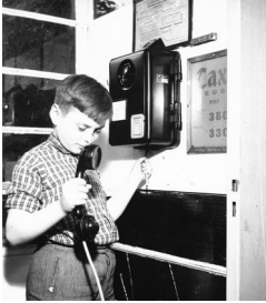
Neuer öffentlicher Münzapparat in Neuss, 1950er Jahre

In Neuss nahm im Jahr 1885 ein, dem Telegrafenamnt angeschlossenes, Telefonamt seinen Betrieb mit anfangs 17 Teilnehmern auf. Der »Fernsprechverkehr« erfreute sich wachsender Beliebtheit, wie der Anstieg der Anschlüsse zeigt. Im Jahr 1910 existieren bereits etwa 600 Telefonanschlüsse in Neuss und bis zum Jahr 1926 war die Zahl auf fast 1900 gestiegen. 27 Während in den ersten Neusser Adressbüchern aus den Jahren 1880er Jahren noch kein Hinweis auf dieses recht neue Medium zu finden ist, deutet später ein eigenes Symbol auf die Teilnehmer des Fernsprechverkehrs hin. Die ersten Anschlüsse besaßen vorrangig wohlhabende Bürger, wie etwa Fabrikbesitzer und Kaufleute. Seit dem Jahr 1899 wurden in Deutschland erste öffentliche Münzfernsprecher aufgestellt und ab den 1920er Jahren gehörten sie bereits zum gewohnten Stadtbild. Die Entwicklung war nicht aufzuhalten, sodass Ende des 20. Jahrhunderts fast jeder Haushalt über einen Festnetzanschluss verfügte.