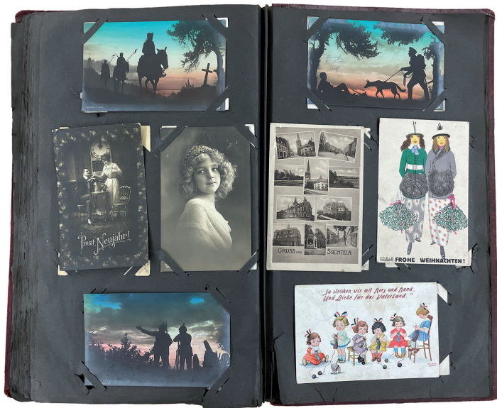
Album mit Postkarten aus dem Ersten Weltkrieg der Neusser Familie Robertz