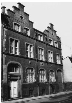
Telegrafenamnt Neuss war durchgehend bis zur Michaelstraße gebaut worden. (heutige Adressen: Promenadenstraße 65–71, Michaelstraße 15–23)

19. Jahrhunderts. Im Jahr 1833 gelang Carl Friedrich Gauß zusammen mit Wilhelm Weber die erste elektromagnetische Telegrafie. 20 Der Begriff des »Telegramms« wurde erstmals im Jahr 1852 verwendet, vorher sprach man von der »telegrafischen Depesche«. 21