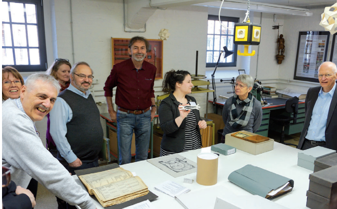
Kommunikation zur Bestandserhaltung in der Werkstatt des Stadtarchivs, »Tag der Archive 2020«

ne« (Botenlöhne) 9 zeigt die Vernetzung der Neusser Stadtverwaltung mit anderen Städten. Zudem verdeutlicht der Eintrag über den erwähnten Botengang die Bedeutung einer Stadtrechnung des Spätmittelalters als historische Quelle. Aus dem Nachweis der Bezahlung des Boten Fais geht nämlich hervor, dass dieser nach Köln geschickt wurde, um den Scharfrichter zu holen. Dessen Auftrag war es, Elsgen van Uerdingen zu foltern, die der Hexerei angeklagt war. 10 Diese Einträge in der Stadtrechnung sind die einzigen Quellenhinweise auf diesen frühesten Neusser »Hexenprozess«.