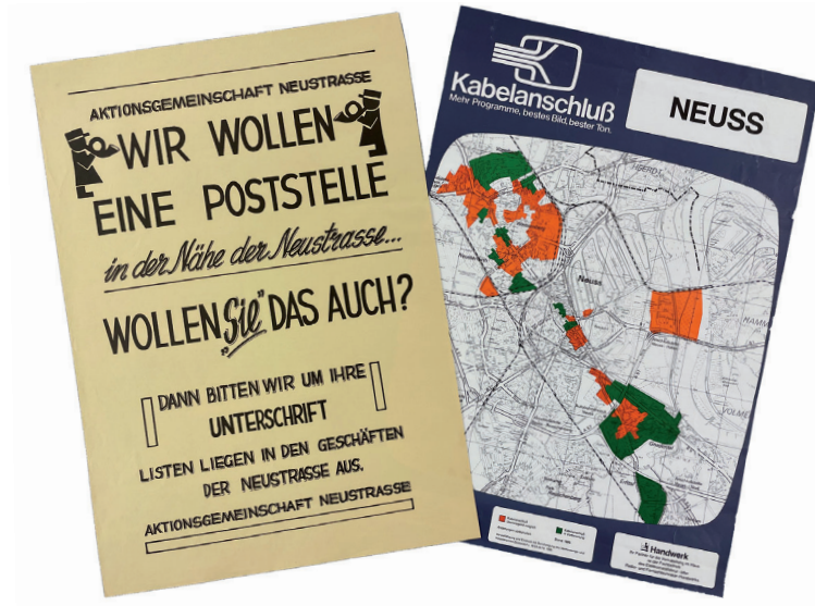
Protestplakat gegen die Verlegung der Post an den Theodor-Heuss-Platz, 1970er Jahre (li.) und Plakat zum Verbreitungsgebiet des neuen Kabelanschlusses in Neuss, April 1985 (re)