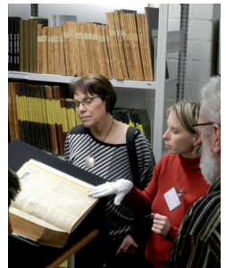
Magazinführung durch acht Jahrhunderte Kommunikationsgeschichte

Das Telegrammwesen hat eine viel längere Vorgeschichte als allgemein hin angenommen wird. Die Anfänge der – damals noch – optisch-mechanischen Telegrafie liegen bereits am Ende des 18. / Anfang des