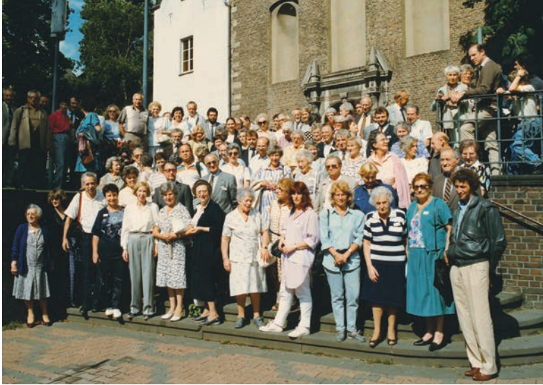
Besuch der ehemaligen jüdischen Bürgerinnen und Bürger vor dem Zeughaus in Neuss, Juli 1988

Im Jahr 2025 jährt sich die erste Verlegung von Stolpersteinen in der Stadt Neuss im Gedenken und zur Erinnerung an die Millionen einzelnen Schicksale der Opfer der Nationalsozialismus zum 20. Mal. Bis heute wird die Aktion des Künstlers Gunter Demnig in Neuss als Teil der Erinnerungskultur im Rahmen der Historischen Bildungsarbeit vom Stadtarchiv Neuss koordiniert.