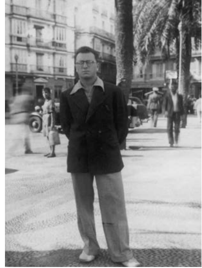
re.: Kurt Jona Mendel nach seiner Flucht in Barcelona, 1944

Mendel wurde einigen der Neusser Jugendlichen von ihren Eltern zeitweise die weitere Teilnahme an den Vorbereitungen für die Auswanderung in Büttgen untersagt. 32 – Für die Hinterbliebenen der Familie Mendel standen nach diesem Schicksalsschlag noch Jahre der Ausgrenzung, Ungewissheit, Flucht, Verfolgung und Ermordung bevor: